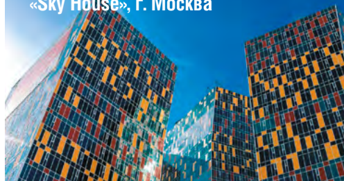
«Sky House», г. Москва